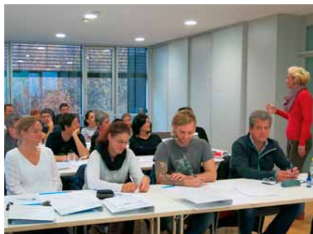
Pflegedokumentationsschulung am Krankenhaus Maria Ebene

Die erste Phase dieses Projekts beschäftigt sich mit den Aspekten der Medikamentensicherheit. Das Pflorgeteam hat allein im Krankenhaus Maria Ebene ca. 120.000 Medikamentenkontakte im Jahr.