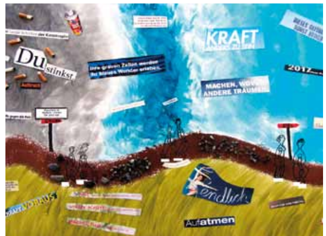
Impressionen von Patienten zum Thema Rauchen