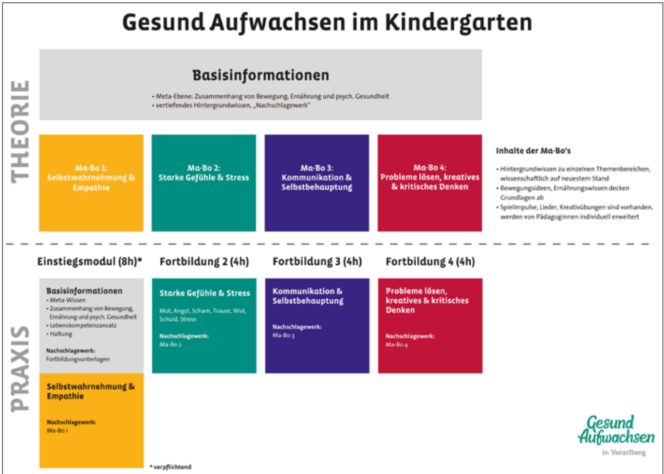
Fortbildungsmodulare für den Bereich Kindergarten

Gefördert aus Mitteln des Gesundheitsförderungsfonds & des Fonds Gesundes Österreich.