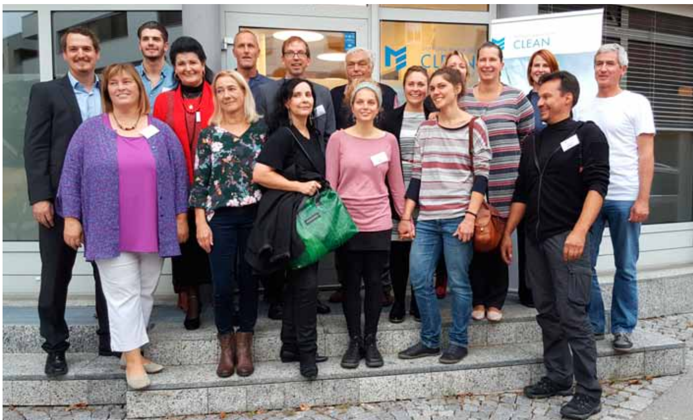
Team Clean Bregenz bei der Eröffnungsfeier der Abgabestelle