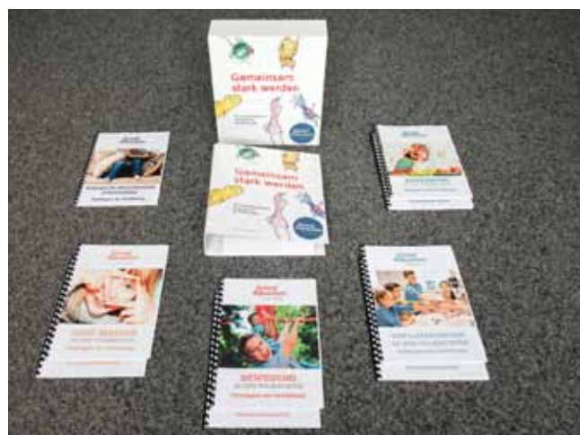
„Gemeinsam stark werden“

Für den Volksschulbereich werden eine dreitägige Fortbildung zum Lebenskompetenzprogramm „Gemeinsam stark werden“ und weitere halbtägige Zusatzfortbildungen zu den Themen „Bewegung“, „Ernährung“, „Gewaltprävention“, „Neue Medien“, „Kinder in belastenden Situationen“ und „Sexualpädagogik“ angeboten.