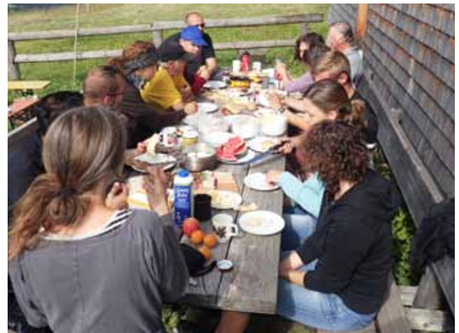
Jause beim „Almerleben“