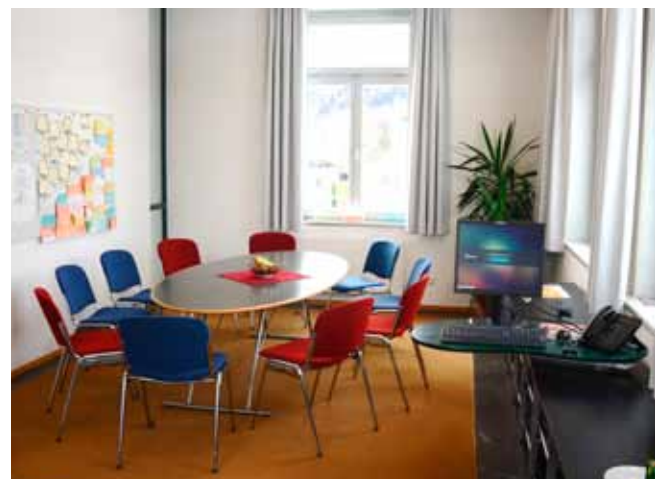
Neu gestaltete Büroräume

Die Therapiestation Carina verfügt über 15 stationäre Therapieplätze, die 2018 in Jahressicht zu 100 Prozent ausgelastet waren und sich auf reguläre Behandlungen sowie Krisen- und Stabilisierungsbehandlungen verteilen. Das therapeutische Konzept folgt den Grundsätzen der „individualisierten Therapie“ in Form individueller Behandlungsplanung, persönlicher Zieleformulierung und flexibler therapeutischer Angebote.