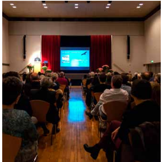
Festvortrag zur 25-Jahr-Feier im Stadtsaal Bludenz