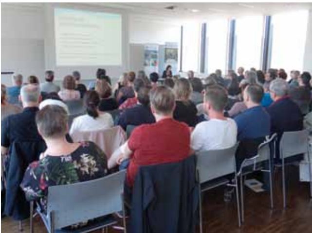
Pflegekongress veranstaltet vom Pflegenetzwerk Sucht

Ein besonderer Höhepunkt im Frühjahr 2018 war die Veranstaltung des zweiten österreichischen Suchtkrankenpflegekongresses des Pflegenetzwerk Sucht im Panorasaal des Landeskrankenhauses Feldkirch.