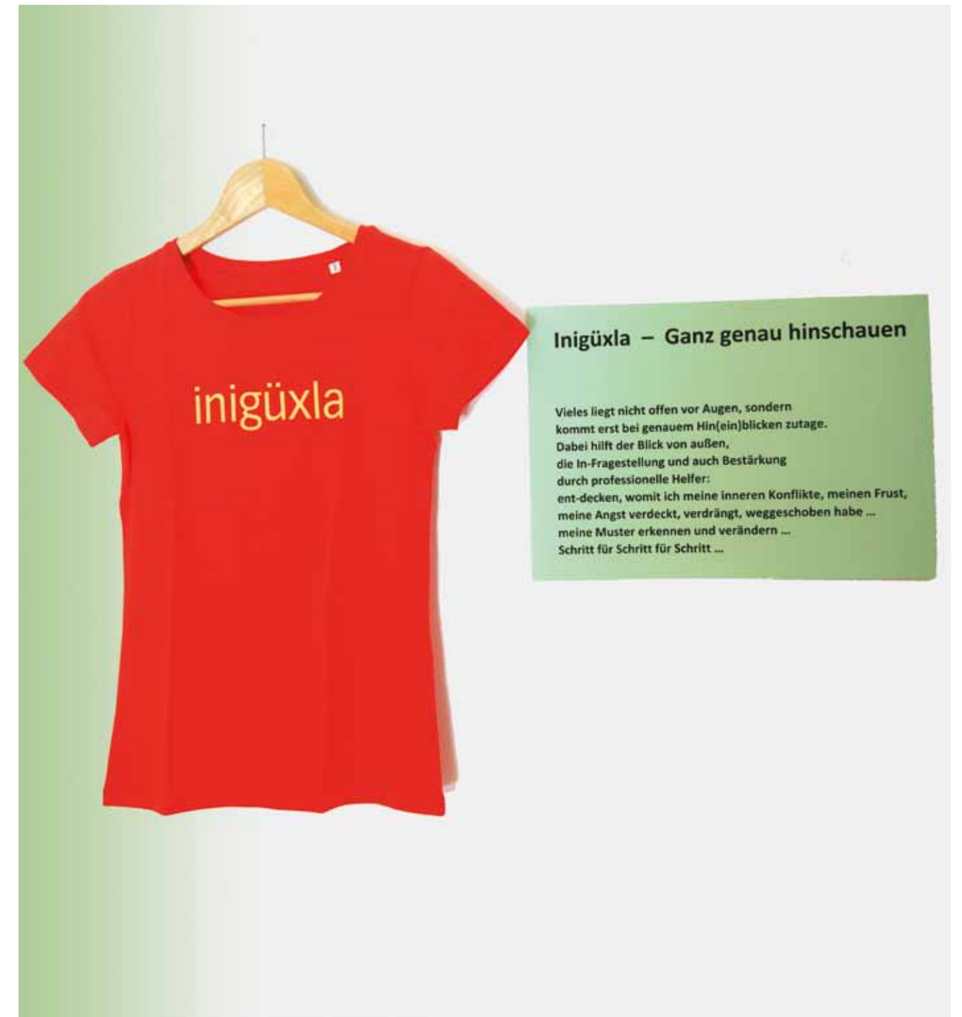
„Inigüxla“ – ganz genau hineinschauen – in die Tiefe blicken

In den Erfahrungen der vielfältigen Arbeit in den drei Beratungsstellen des Cleans zeigte sich auch im Berichtsjahr wieder: diese Herausforderung anzunehmen lohnt sich!