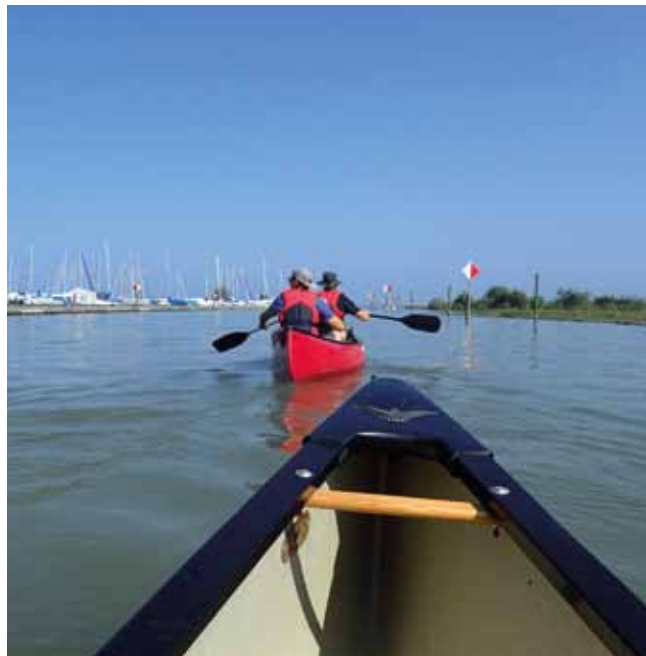
Beim Kanufahren lernen Patienten miteinander Balance zu halten