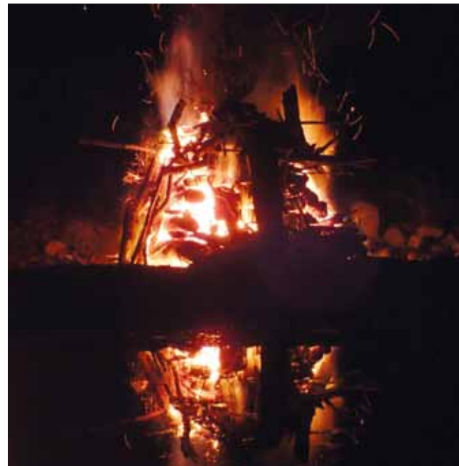
Schwitzhüttenritual – Altes wird losgelassen und schafft Platz für Neues