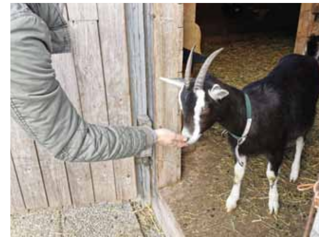
Tiere sind eine emotionale und soziale Unterstützung

Die Ziegen und Kaninchen werden von unseren Patienten gepflegt und versorgt, in enger Betreuung mit den Ergotherapeuten wird stetig Rücksprache gehalten. „Eine große Verantwortung übernehmen zu dürfen, die Unvoreingenommenheit im Kontakt wahrnehmen – die Ziegen freuen sich über jeden Besuch, beobachten und zur Ruhe kommen, Freude erleben, Wertschätzung erfahren, Wärme spüren, super gegen Langeweile, sinnvolles Tun...“, alles Rückmeldungen von Patienten, die Kontakt zu unseren Tieren hatten. Sie bereichern den Therapiealltag der Patienten und damit auch unseren.