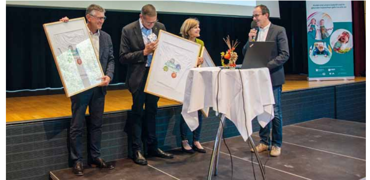
Im Oktober fand im Veranstaltungszentrum KOM in Altach die „Gesund Aufwachsen Tagung“ statt.

Im Rahmen der Suizidprävention wurde 2019 neben Maßnahmen zur Sensibilisierung, Information und Enttabuisierung ein Fokus auf Schulungsmaßnahmen für Multiplikatoren und