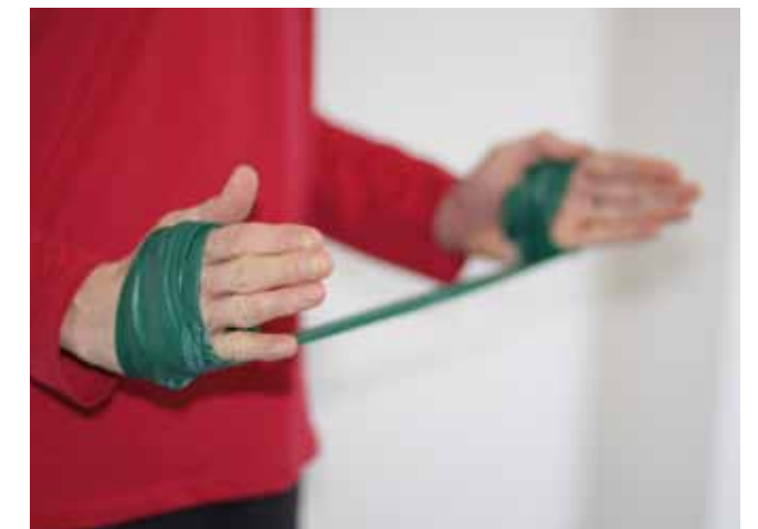
Sport zu betreiben verheißt in erster Linie Spaß und Glück

Wirbelsäulengymnastik wird auch die Bewegung in der Natur großgeschrieben. Kurze und lange Wanderungen und auch Nordic Walking, bei jedem Wetter sind die Patientengruppen im Freien unterwegs. Es werden Möglichkeiten aufgezeigt, wie die Bewegung bestmöglich, auch nach dem Therapieaufenthalt, in den Alltag integriert werden kann. Auch am Wochenende, in den frühen Morgenstunden und auch abends, können die Patienten den Ergometer für sich nutzen. Regelmäßige Ausflüge in die nahegelegene Boulderhalle sollen die Möglichkeit bieten, sich unter An- und Begleitung auszuprobieren, neue Interessen zu entdecken oder altbekannte Fertigkeiten wieder aufzufrischen.