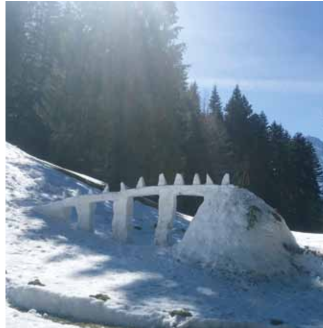
Vorhandene Ressourcen werden phantasievoll beim Iglubau eingesetzt