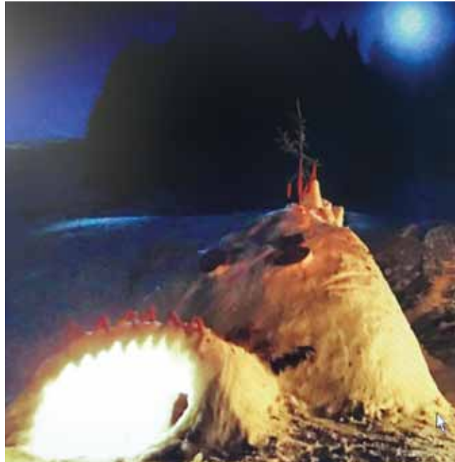
Abendstimmung bei den Outdoor Tagen