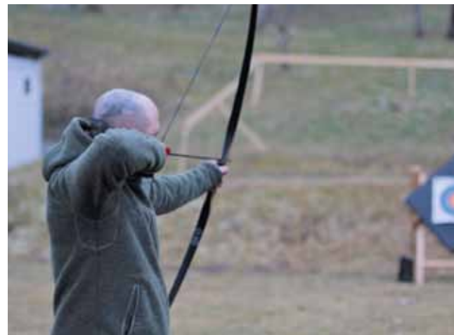
Bogenschießen hilft der Persönlichkeitsentwicklung

Den Patienten wird die Möglichkeit geboten, sich selbst besser kennen zu lernen, neue Erfahrungen zu machen und die eigenen Fähigkeiten wahrzunehmen. Für das Jahr 2020 sind regelmäßige Ausflüge in unterschiedliche Bogenschieß-Parcours in Vorarlberg geplant; hierbei können Kontakte geknüpft und mögliche erste Schritte für eine Ausübung nach dem stationären Aufenthalt gesetzt werden.