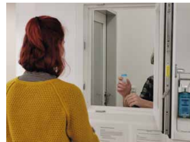
Abgabestelle Clean in Bregenz

Gut angenommen wurde das Angebot der neuen Abgabestelle in Bregenz, das seit September 2018 für eine Teilgruppe von gesundheitlich und psychosozial schwer belasteten Substituierten zur Verfügung steht. Seit Eröffnung der Abgabestelle nahmen 64 Klienten dieses Angebot in Anspruch. Durch den regelmäßigen Kontakt mit dem Fachpersonal konnten unterstützende Interventionen in schwierigen Lebensphasen und nötige Therapieanpassungen früher und rascher durchgeführt werden.