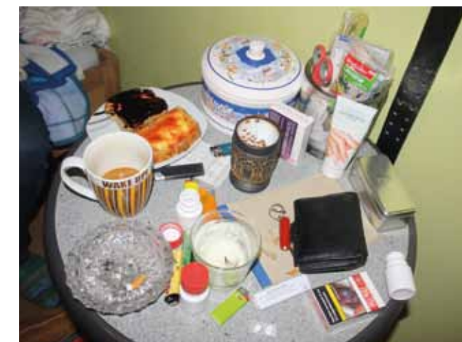
Ambulant betreutes Wohnen

In der eigenen Wohnung zu leben ist für die meisten Menschen eine Selbstverständlichkeit. Manchen Menschen mit Suchterkrankungen gelingt dies nicht immer ohne fremde Hilfe.